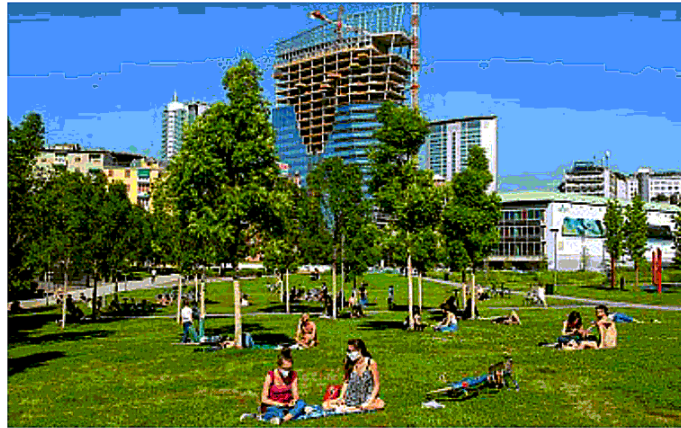
La ripresa I milanesi tornano a uscire e a prendere il sole nel parco La Biblioteca degli alberi dopo il periodo di chiusura